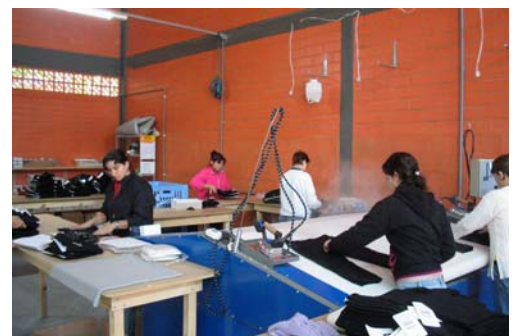
Ironing, labelling, folding and parking 5 persons Planchado, plegado y embolsado 5 personas