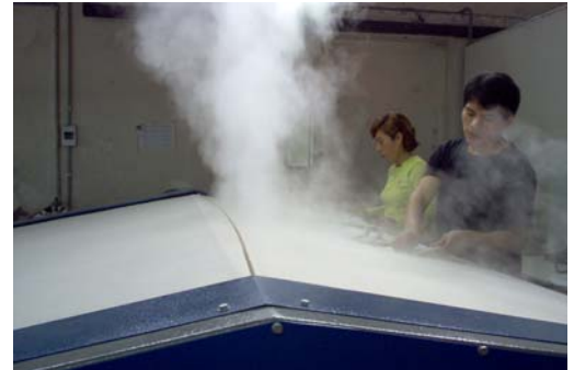
Ironing with steam and special gloves Planchado con vapor y guantes especiales