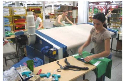
Ironing labelling holding and hanging 3 persons Planchado plegado y percha 3 personas