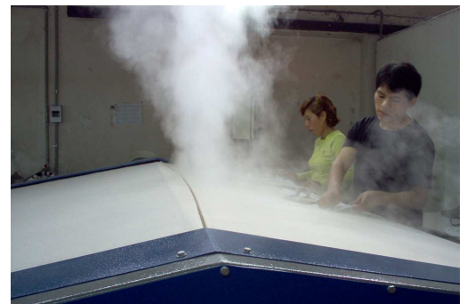
Ironing with steam and special gloves Planchado con vapor y guantes especiales