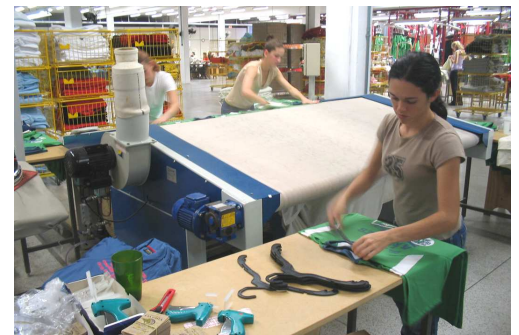
Ironing labelling holding and hanging 3 persons Planchado plegado y percha 3 personas