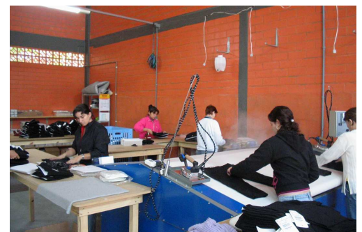
Ironing, labelling, folding and parking 5 persons Planchado, plegado y embolsado 5 personas