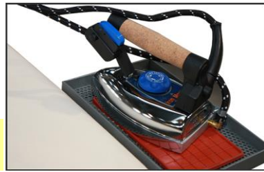
Optional hand ironing machine Plancha de mano opcional