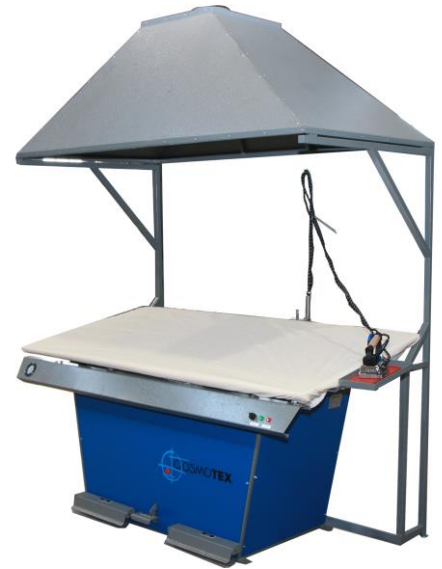
Steam extracting cabin optional Cabina extractora de vapor opcional

Achieve maximum performance, Cosmotex ironing machine offers the flexibility for a wide variety of applications to iron any kind of knit wear. TV is able for ironing from simple T-shirt to high quality sweaters. Easy to use: easy to learn and easy to operate for one or two operators which can iron one or two pieces at the same time. Easy Maintenance and reliability: low ongoing costs for parts and maintenance labour. Machine fitted with standard electronic parts that you can find easily in your local market. Working surface of large dimensions: Dimensions from 1800 x 800mm to 3000 x 1000mm. All the models have a steam chambers to guarantee an optimum thermal exchange and ensure the uniformity and quicker spread of the steam along the plate surface) as opposed to older type system which run steam through coiled tubes or the models with electrical resistances as used by other machine producers.